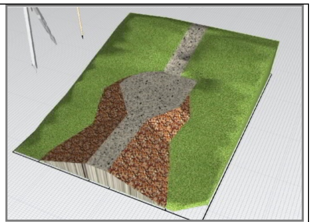
Рис.3 3D модель платформы Apparel

Используя 2D-проект на плоскости платформы Apparel, 3D-модель пространства будет построена на основе заданной высоты. (Рисунок 3). Таким образом, использование трехмерных моделей вертикального моделирования для освоения проектирования водных